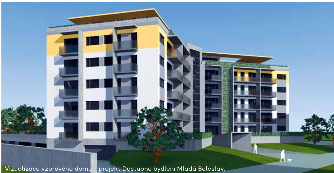
Vizualizace vzorového domu – projekt Dostupné bydlení Mladá Boleslav.

Dostupné bydlení musí být prioritou i ve státním rozpočtu.