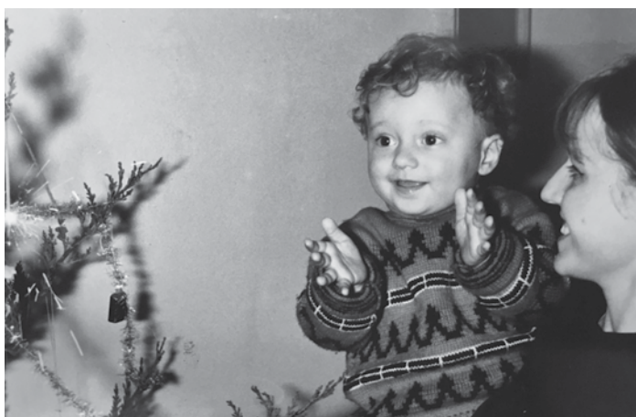
S maminkou – moje první prskavka