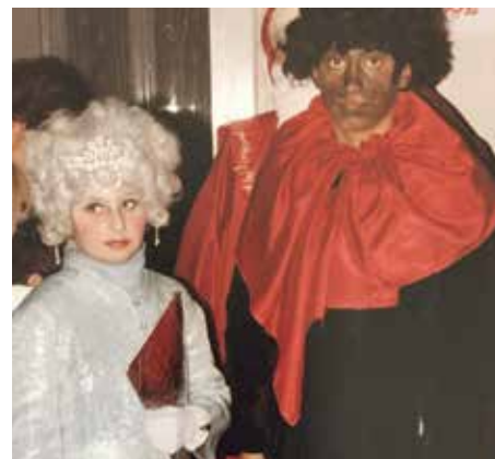
S mou sestrou – čertík a anděl