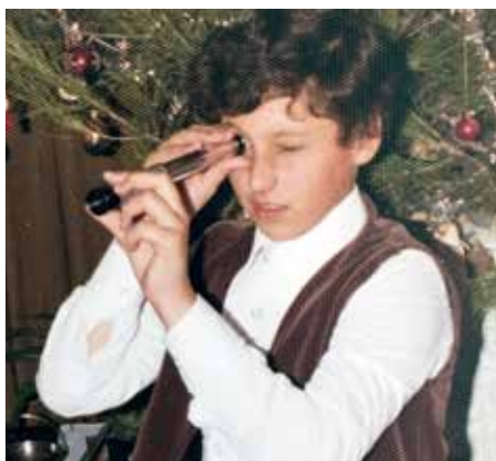
Nahlížím do budoucnosti