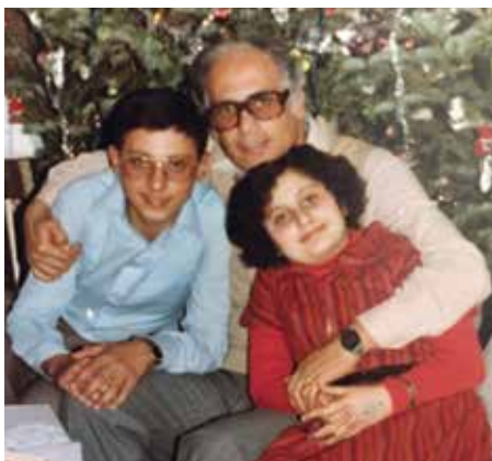
S tatínkem a sestrou