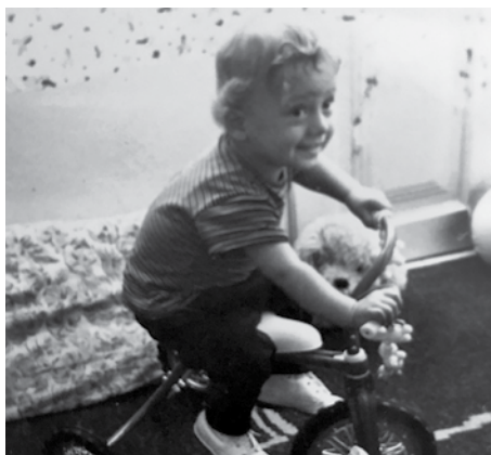
Od malička miluji kolečka