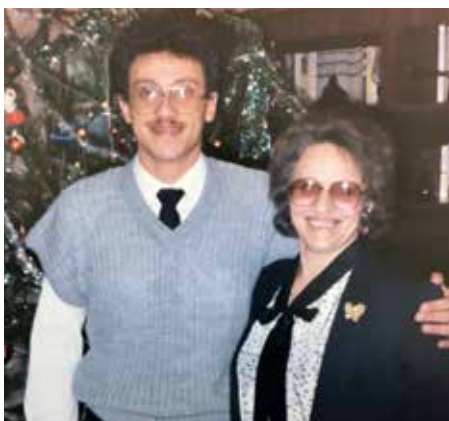
S maminkou o Vánocích