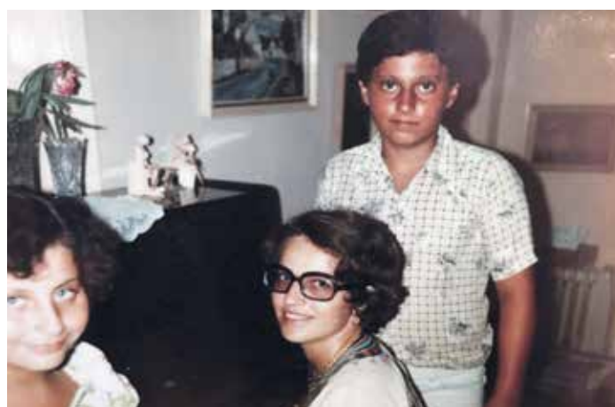
S maminkou a sestrou u piána