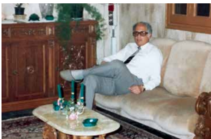
Tatínek v obývací